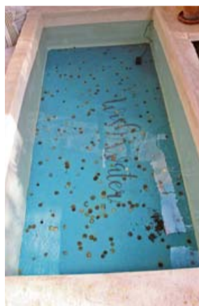
Der Wunschebrunnen im Hinterhof der Senseless Art Gallery.

Noch Bedarf an einem besonderen Geschenk? Die Senseless Art Gallery in Sencelles hat elf Künstler gebeten, einen Vorschlag zu unterbreiten